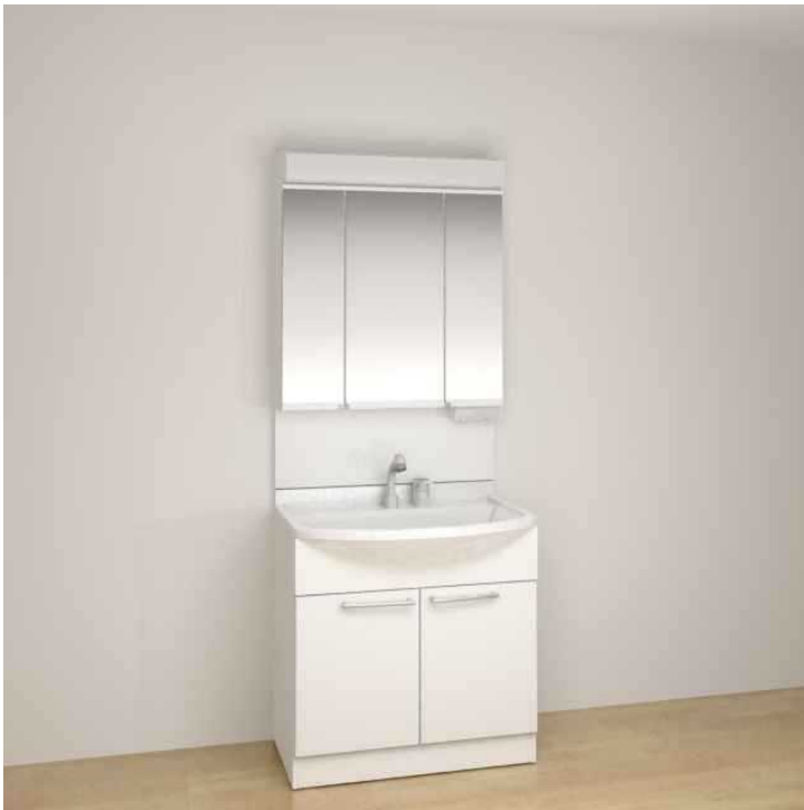
画像はイメージです。組合せなどはお見積書をご確認ください。